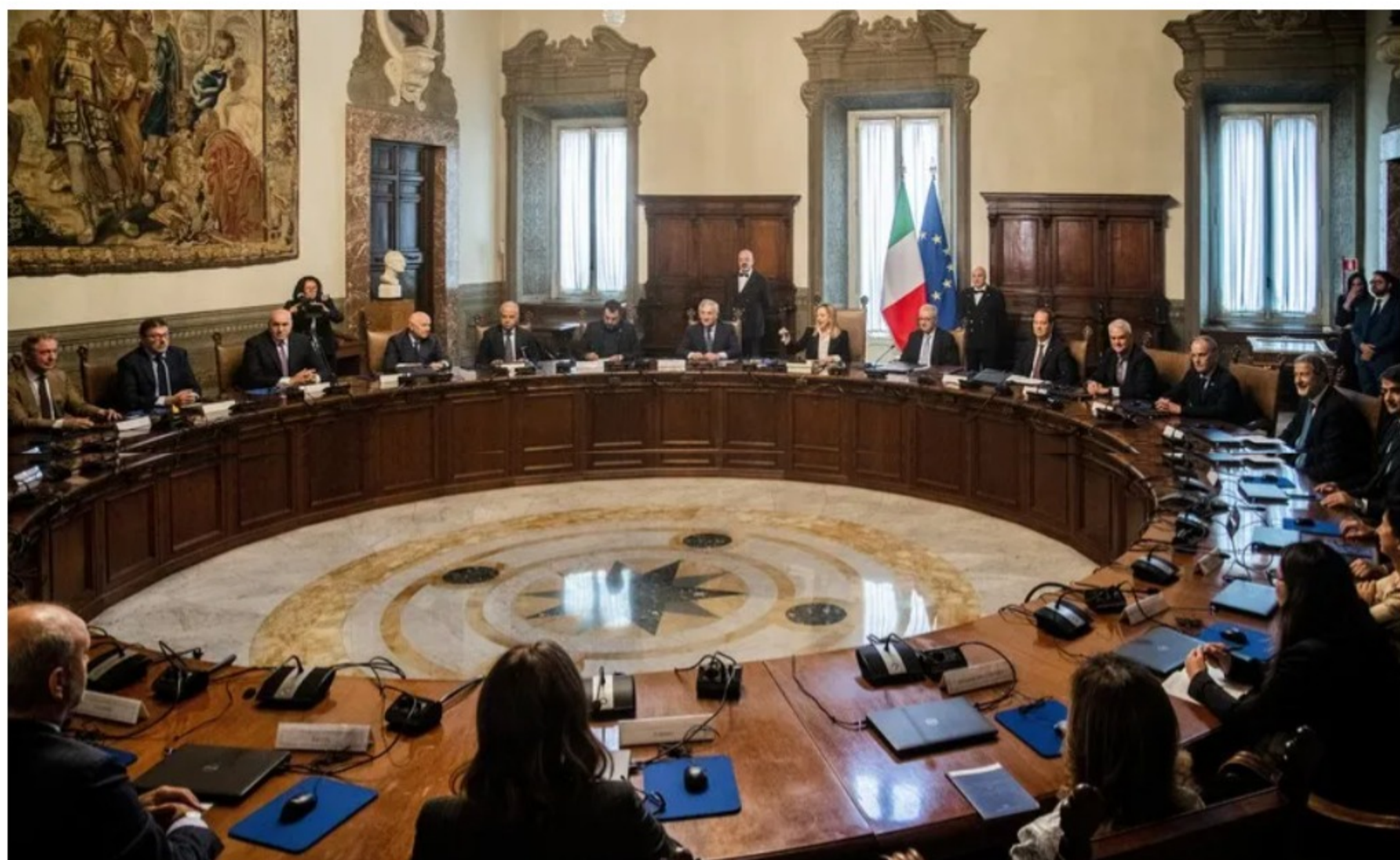
Consiglio dei Ministri dedicato al DEF

Nel Documento di Economia e Finanza (DEF) approvato l'11 aprile scorso dal Consiglio dei Ministri ci sono alcune interessanti tabelle con dati e grafici, soprattutto per le proiezioni fino all'anno 2070. Il confronto tra i dati attuali e quelli previsti nei prossimi 50 anni, rivela qual è la prospettiva e la visione dell'Italia che verrà.